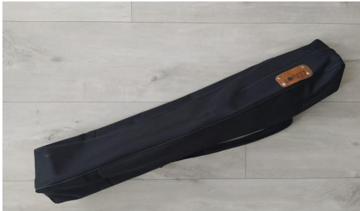
Рис. 3. Чехол для хранения Конструктора.