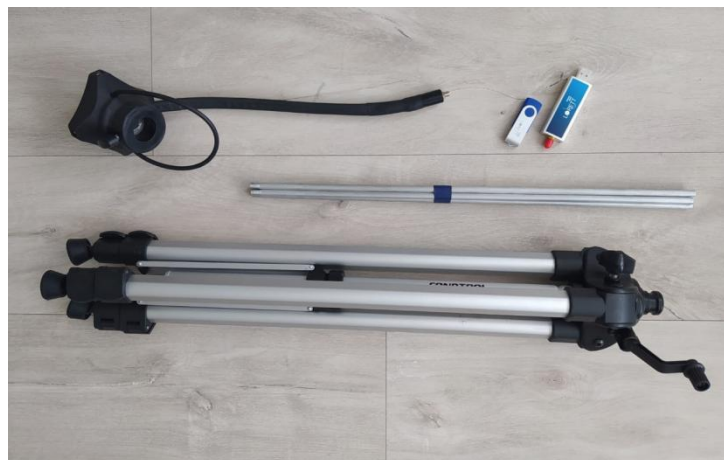
Рис. 2. Конструктор в разобранном виде.