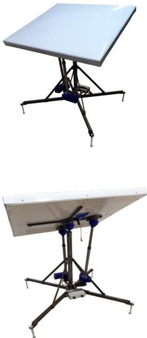
Рис. 1. Внешний вид комплекса «Планум»