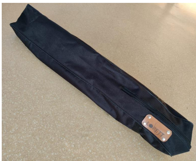
Рис. 2. Чехол для хранения Конструктора